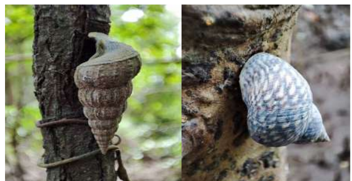
Figura 2. a. Cerithideopsis montagnei , b. Littoraria varia .