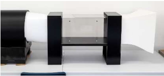
Figura 1. Avances de Túnel de Viento.

1- Universidad Autónoma de Chiriquí, 2- Investigador Principal, 3- Co-Investigador, 4- Asesor, 5- Co-Asesor, 6- Escuela de Física, 7- Centro Investigación de Biotecnología Agroalimentaria y Física Aplicada (Biofisagro)