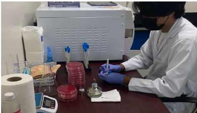
Figura 1. Tesista preparando las muestras para su siembra y análisis en la búsqueda de Staphylococcus aureus resistente a la meticilina (SARM).

1- Investigador principal, 2- Coinvestigador, 3- Asesor, 4- Coasesor, 5- Instituto de Investigación y servicios clínicos (IISC), 6- Sección de microbiología del Hospital Rafael Hernández, 7- Universidad Tecnológica de Panamá, 8- Instituto de Investigaciones Científicas y Servicios de Alta Tecnología (INDICASAT), 9- Escuela de Tecnología Médica.