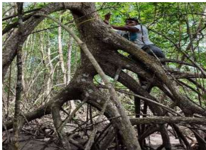
Figura 1. Muestreo en el Manglar.

Los manglares son ecosistemas costeros muy productivos que brindan hábitats clave para diversas especies y servicios esenciales como la captura de carbono y protección costera. Su estructura depende de factores ambientales y la interacción con la macrofauna, un indicador sensible a alteraciones.