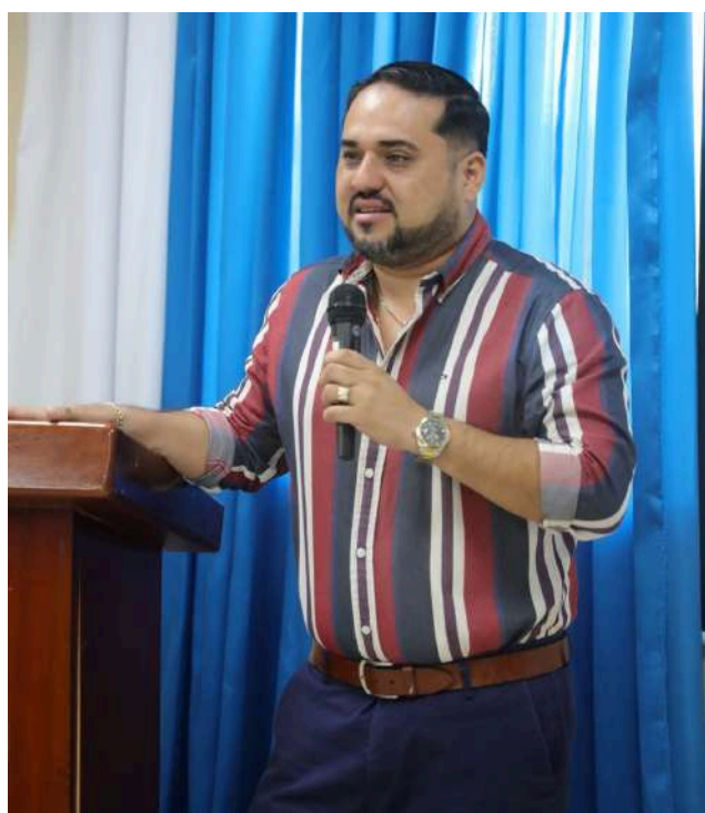
Honorable Diputado Jamis Acosta.