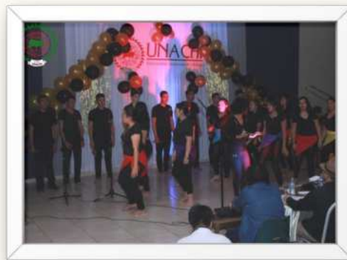
Ilustración 8 Grupos artísticos de la dirección de Cultura de la vicerrectoría de extensión, izquierda Grupos Polifónico “A Viva Voz”, derecha Grupo Orquesta Sinfónica, abajo grupo Nāgbe Käre

La Orquesta y Coro Universitario de la UNACHI tiene como función principal promover y difundir el arte musical dentro y fuera de la universidad. A través de conciertos, presentaciones y participaciones en eventos culturales, busca enriquecer la experiencia educativa y cultural de los estudiantes y la comunidad en general. Además, fomenta el desarrollo artístico de sus integrantes y fortalece la identidad cultural de la institución.