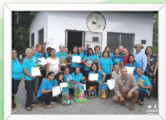
Ilustración 13 La Universidad Popular de Alanje ofreció el curso de tejas decorativas de alto relieve en el Distrito de Alanje