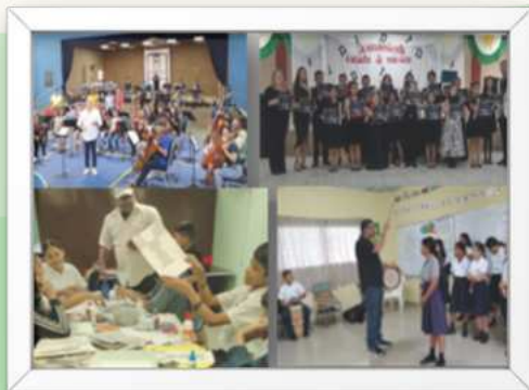
Ilustración 9 Labores de extensión a través de la Dirección de Cultura de la Vicerrectoría de Extensión, con impacto en la sociedad, 2024.