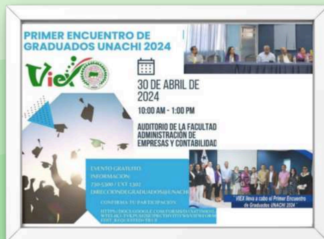
Ilustración 5. Primer Encuentro de Graduados, 2024

Fomentar la conexión entre los graduados y la Universidad Autónoma de Chiriquí para crear vínculos, compartir experiencias y establecer redes profesionales. Celebrar logros individuales y promover la colaboración en futuros proyectos.