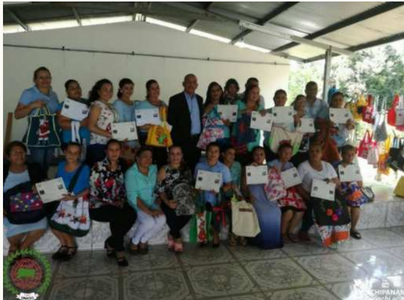
Ilustración 17 Seminario de pintura, organizada por la Vicerrectoría-Autónoma de Chiriquí, dirigida a la comunidad general