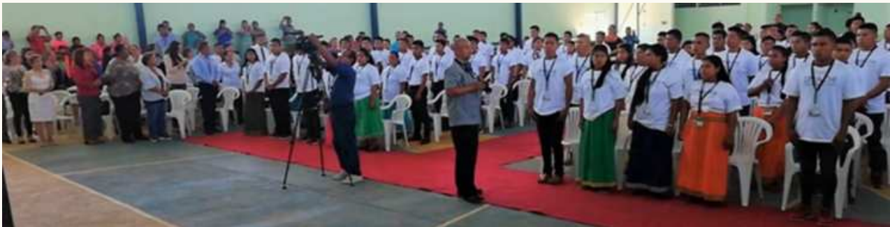
Ilustración 15 Más de 30 personas residentes en los diferentes corregimientos del Distrito de Dolega, participaron en el Curso sobre el “Uso de Drones en la Agricultura y la Ganadería”, organizado por la Vicerrectoría de Extensión de la Universidad Autónoma de Chiriquí (UNACHI), en coordinación con los representantes y la Alcaldía de este Municipio.

Ilustración 14 La Universidad Autónoma de Chiriquí (UNACHI) a través de la Vicerrectoría de Extensión, en coordinación con el Ministerio de Salud (MINSa) llevaron a cabo la Ceremonia de Graduación a 83 estudiantes indígenas de la Comarca Ngäbe Buglé, obteniendo el Diplomado en Promoción de la Salud, el acto se realizó en el gimnasio del Instituto Profesional y Técnico, Abel Tapiero del distrito de San Lorenzo, Provincia de Chiriquí, para el 2020, acompañado de autoridades de la UNACHI, MINSa, personal administrativo, y público en general.