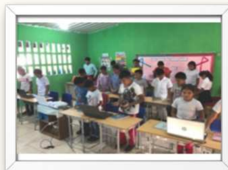
Ilustración 1 clases de reforzamiento en matemáticas aplicadas por los estudiantes de escuelas en tierras altas