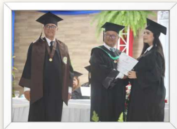
Tabla 3, sobre las actividades de la Dirección de Graduados de la Vicerretoría de Extensión