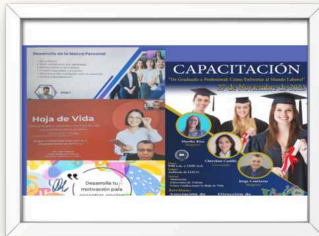
Ilustración 4- Capacitación: De Graduados a Profesionales ¿Cómo Enfrentar al Mundo Laboral?

Dicha actividad, se enfoca en brindar diferentes habilidades especializadas que no siempre se adquieren en la educación formal. Una capacitación para graduados se vuelve crucial en un entorno laboral competitivo..