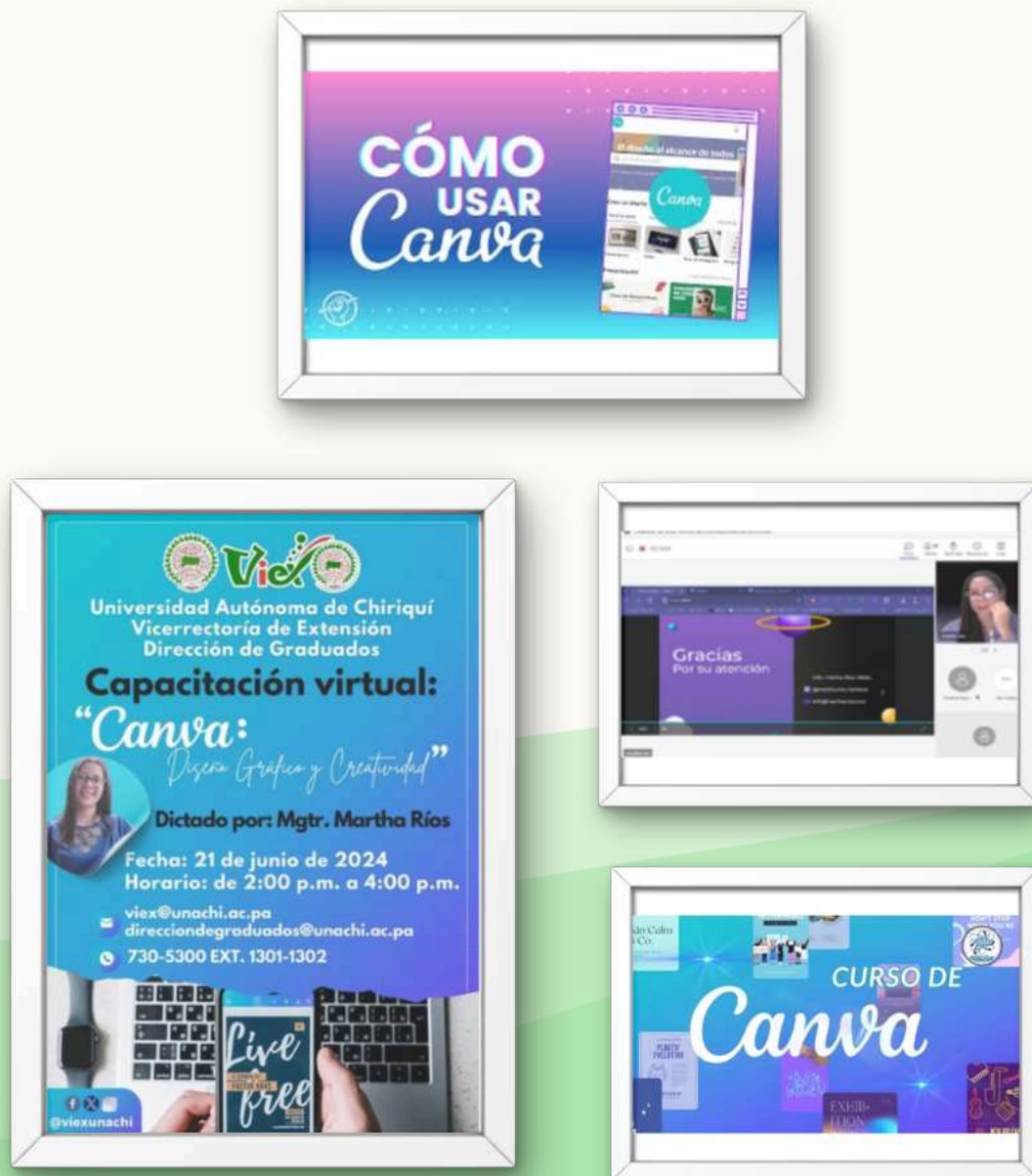
Ilustración 6. Capacitación virtual: “canva: diseño gráfico y creatividad, 2024”

Adquirir competencias avanzadas para el uso de Canva, aplicando habilidades de diseño gráfico, creatividad y estrategias visuales para la fácil comunicación con la audiencia pública y virtual, destacando ideas frescas, nuevas y versátiles para el contenido de diversas plataformas digitales, contribuyendo así a su éxito profesional-