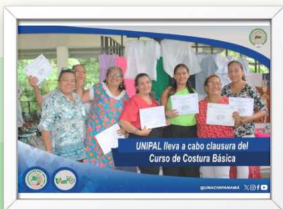
Ilustración 12 Universidad Popular de Alanje lleva el Curso de Costura al Distrito