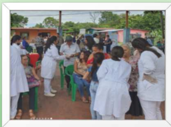
Ilustración 3 proyecto de SSU de la Facultad de Enfermería