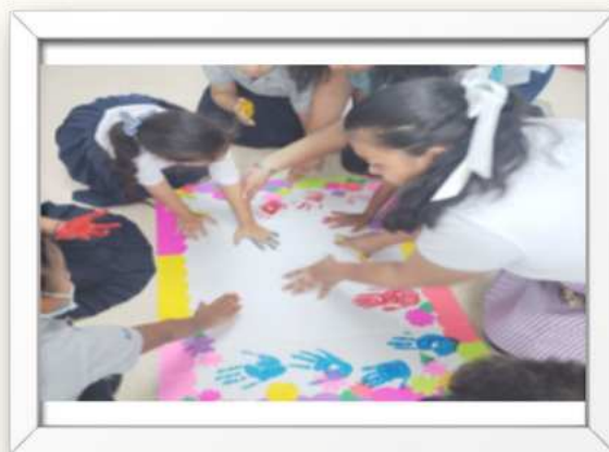
Ilustración 2 proyecto de SSU, desarrollo de estrategias de intervención pedagógica para niños (as) de educación inclusiva en la Escuela Bilingüe de Gualaca