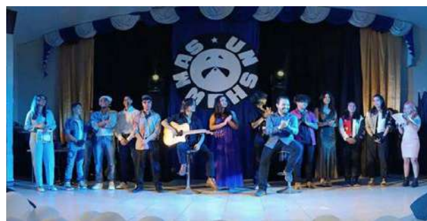
Participantes del evento: Un show más.