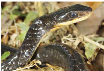
Chironius grandisquamis Culebra, Cazadora