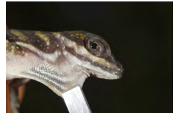
Anolis aquaticus Anolis papera del juvenil