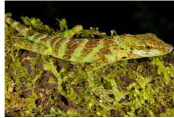
Anolis casildae Anolis gigante