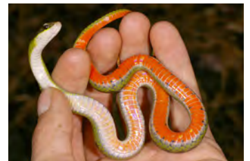
Liophis epinephelus Falsa coral