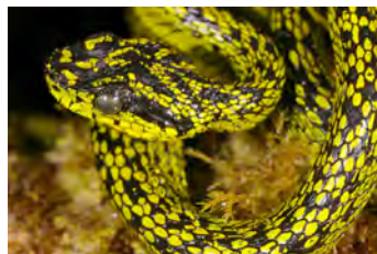
Bothriechis nigroviridis Oropél