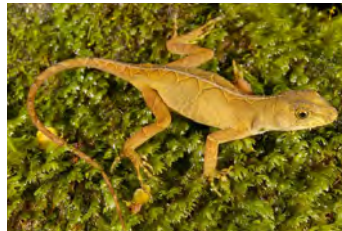
Anolis pachypus Anolis