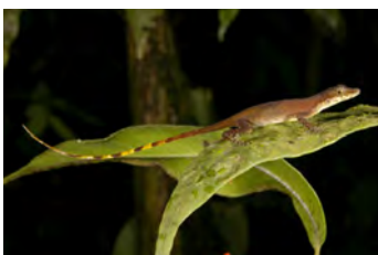
Anolis limifrons Anolis