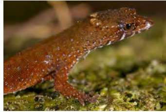
Lepidoblepharis xanthostigma Gecko de hojarasca