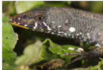
Neusticurus apodemus Lagartija