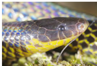
Geophis godmani Culebra de tierra, Minadora