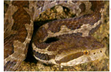
Cerrophidion godmani Toboba de altura notese foseta loreal entre nariz y ojo