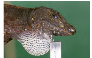
Anolis pseudopachypus Anolis papera de la ♀