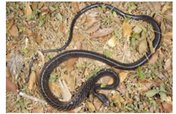
Chironius grandisquamis Culebra, Cazadora