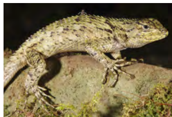
Sceloporus malachiticus Lagartija espinosa ♀