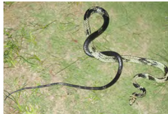
Spilotes pullatus Mica, Ratonera