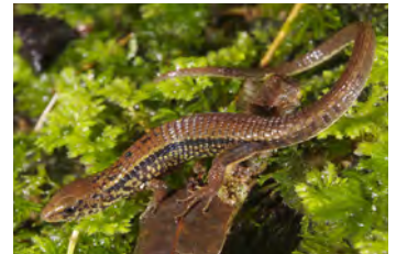
Ptychoglossus plicatus Lagartija