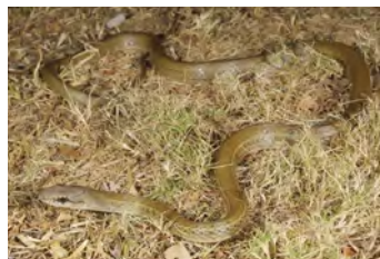
Mastigodryas melanolomus Corredora, Zumbadora