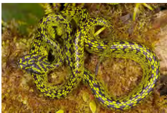
Bothriechis nigroviridis Oropél