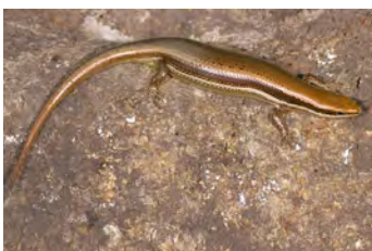
Mabuya unimarginata Lisa