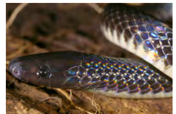
Geophis brachycephalus Culebra de tierra, Minadora variación negra