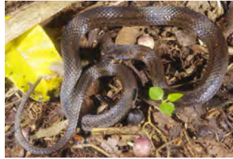
Amastridium veliferum Culebra