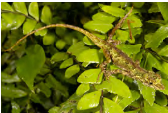
Anolis datzorum Anolis