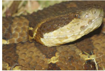
Atropoides picadoi Mano de piedra notese foseta loreal entre nariz y ojo