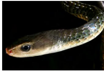
Chironius carinatus Culebra, Cazadora