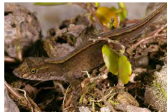
Anolis humilis Anolis