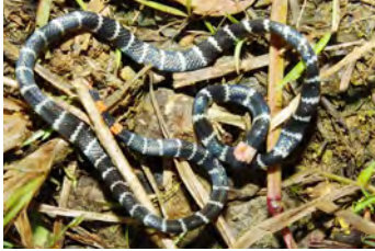
Micrurus multifasciatus Coral