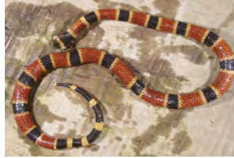
Micrurus nigrocinctus Coral animal muerto