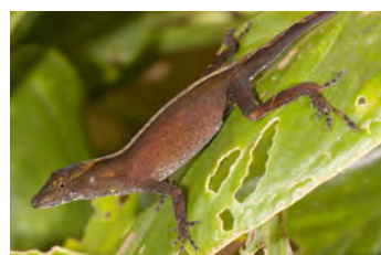
Anolis polylepis Anolis