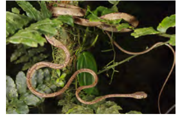
Imantodes cenchoa Bejuquilla de cabeza redonda