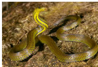
Rhadinaea calligaster Hojarasquera (de vientre manchado)