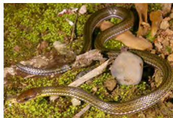
Urotheca sp. Hojarasquera, Cola de vidrio