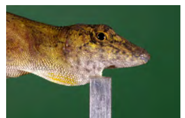
Anolis polylepis Anolis papa de la ♀