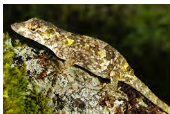
Anolis salvini Anolis