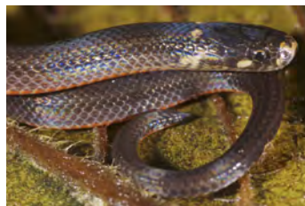
Trimetopon slevini Culebra enana