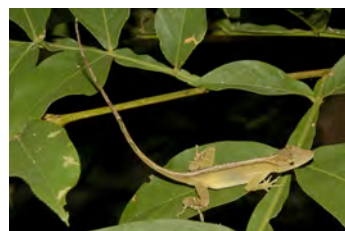
Anolis limifrons Anolis