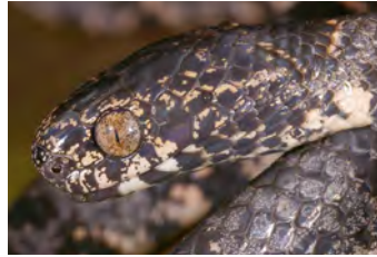
Sibon nebulatus Caracolera