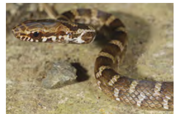
Mastigodryas melanolomus Corredora, Zumbadora juvenil