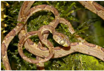
Imantodes cenchoa Bejuquilla de cabeza redonda