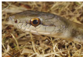
Mastigodryas melanolomus Corredora, Zumbadora