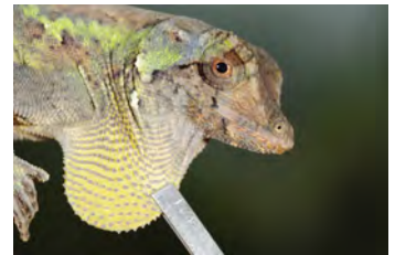
Anolis capito Anolis papera de la ♀