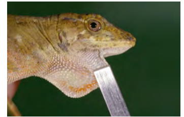
Anolis pachypus Anolis papera de la ♀