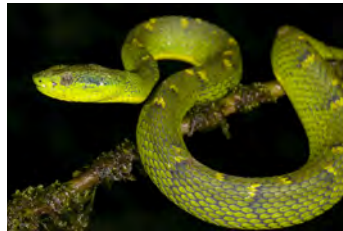
Bothriechis lateralis Lora