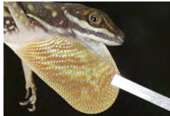
Anolis aquaticus Anolis papera del ♂