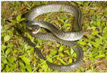
Chironius carinatus Culebra, Cazadora