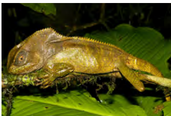
Corytophanes cristatus Lagartija crestada, Turipache