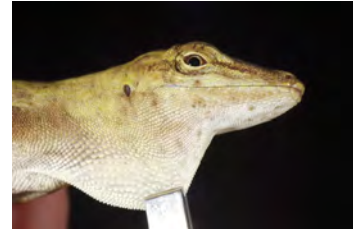
Anolis fortunensis Anolis papa de la ♀