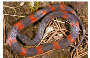
Geophis talamancae Culebra de tierra, Minadora variación "falsa coral"