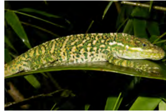
Anolis microtus Anolis gigante