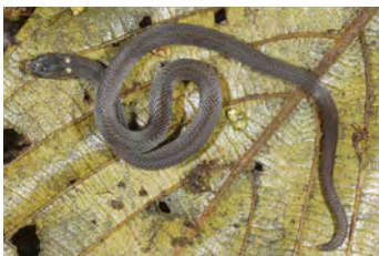
Trimetopon slevini Culebra enana