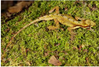
Anolis magnaphallus Anolis

documentados en esta área y, si no se indica otra cosa, fotografiados por Sebastian Lotzkat Senckenberg Instituto de Investigación y Museo de Historia Natural & Goethe-Universität, Instituto de Ecología, Evolución & Diversidad Frankfurt am Main, Alemania; E-mail: lotzkat@yahoo.com