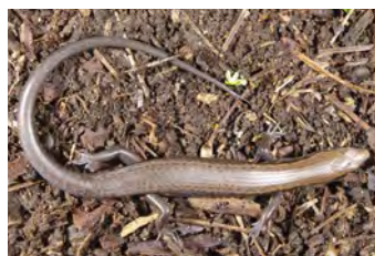
Sphenomorphus cherriei Lisa