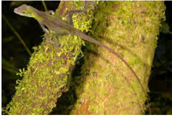
Anolis casildae Anolis gigante

documentados en esta área y, si no se indica otra cosa, fotografiados por Sebastian Lotzkat Senckenberg Instituto de Investigación y Museo de Historia Natural & Goethe-Universität, Instituto de Ecología, Evolución & Diversidad Frankfurt am Main, Alemania; E-mail: lotzkat@yahoo.com