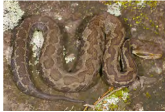
Cerrophidion godmani Toboba de altura