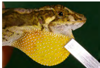
Anolis pseudopachypus Anolis papera del ♂