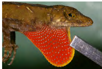
Anolis humilis Anolis papa del ♂