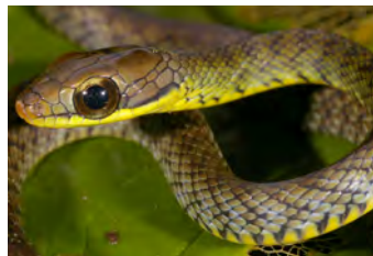
Dendrophidion paucicarinatum Culebra, Corredora