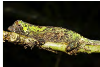
Anolis capito Anolis juvenil