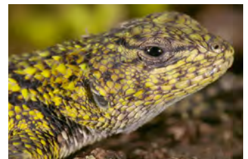
Sceloporus malachiticus Lagartija espinosa juvenil