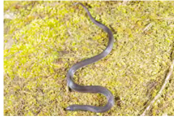
Geophis tectus Culebra de tierra, Minadora