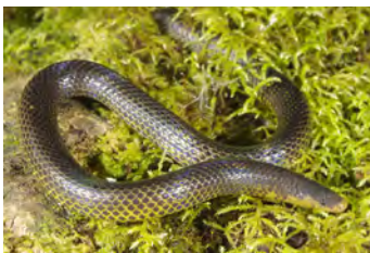
Geophis godmani Culebra de tierra, Minadora