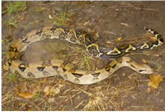
Boa constrictor Boa

documentados en esta área y, si no se indica otra cosa, fotografiados por Sebastian Lotzkat Senckenberg Instituto de Investigación y Museo de Historia Natural & Goethe-Universität, Instituto de Ecología, Evolución & Diversidad Frankfurt am Main, Alemania; E-mail: lotzkat@yahoo.com