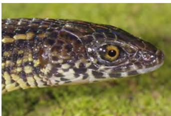
Ptychoglossus plicatus Lagartija