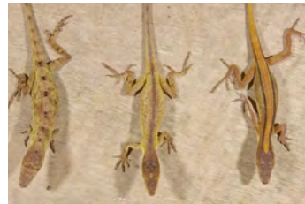
Anolis kemptoni Anolis variaciones de dibujo dorsal