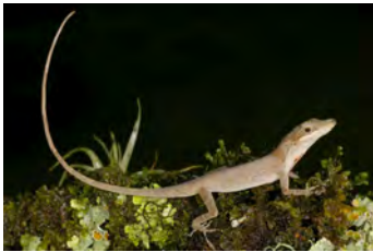
Anolis kemptoni Anolis