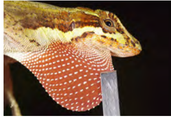
Anolis magnaphallus Anolis papera del ♂