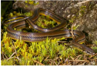
Rhadinaea godmani Hojarasquera (de vientre amarillo)

documentados en esta área y, si no se indica otra cosa, fotografiados por Sebastian Lotzkat Senckenberg Instituto de Investigación y Museo de Historia Natural & Goethe-Universität, Instituto de Ecología, Evolución & Diversidad Frankfurt am Main, Alemania; E-mail: lotzkat@yahoo.com