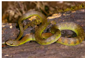
Liophis epinephelus Falsa coral