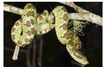
Bothriechis supraciliaris Víbora de pestañas, Oropél