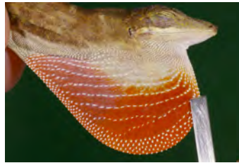
Anolis kemptoni Anolis papa del ♂