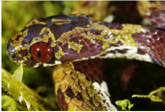
Sibon annulatus Caracolera