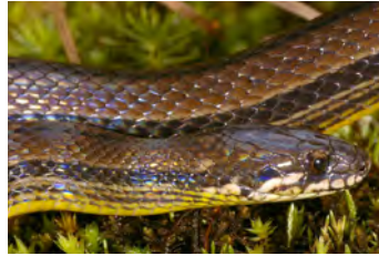
Rhadinaea godmani Hojarasquera (de vientre amarillo)