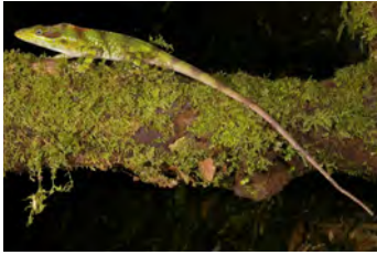
Anolis microtus Anolis gigante