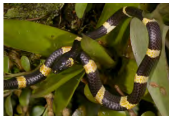
Dipsas articulata Caracolera, Falsa coral juvenil