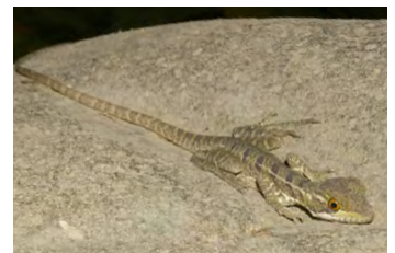
Basiliscus basiliscus Lagarto Jesucristo, Moracho juvenil