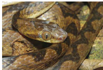
Leptodeira septentrionalis Ranera, Ojos de gato