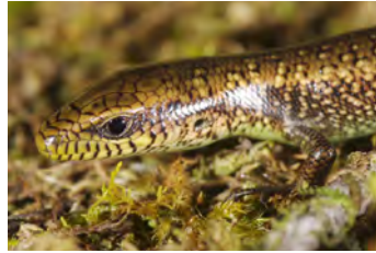
Celestus sp. Lagartija juvenil