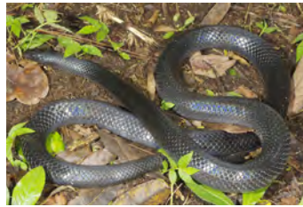
Lampropeltis triangulum Falsa coral, Serpiente de leche variación negra