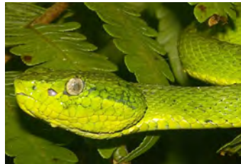
Bothriechis lateralis Lora notese foseta loreal entre nariz y ojo