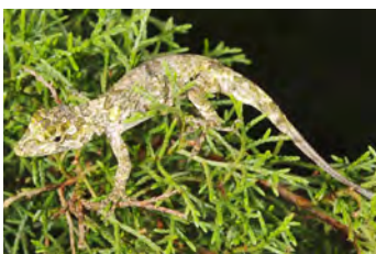
Anolis salvini Anolis