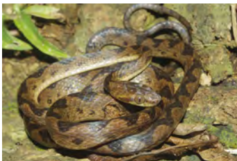
Leptodeira septentrionalis Ranera, Ojos de gato