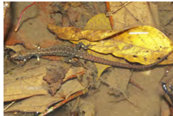
Neusticurus apodemus Lagartija