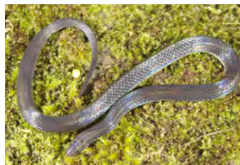
Geophis brachycephalus Culebra de tierra, Minadora variación negra