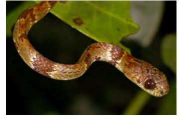
Sibon annulatus Caracolera