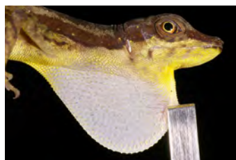
Anolis limifrons Anolis papa del ♂