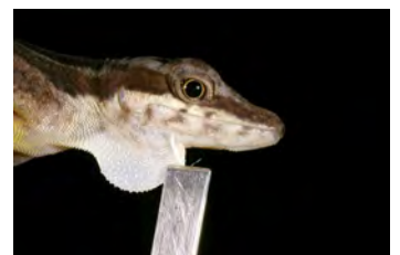
Anolis limifrons Anolis papa de la ♀