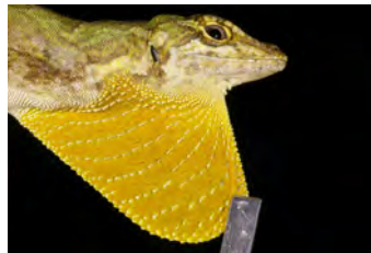
Anolis datzorum Anolis papera del ♂