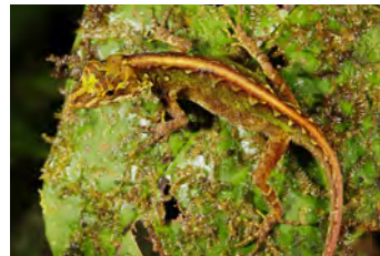
Anolis datzorum Anolis