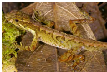
Anolis pseudopachypus Anolis