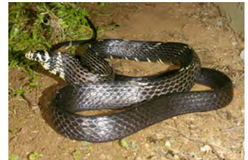
Spilotes pullatus Mica, Ratonera