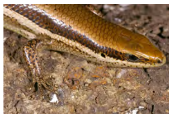
Mabuya unimarginata Lisa