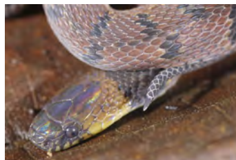
Ninia maculata Culebra de café