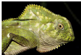
Corytophanes cristatus Lagartija crestada, Turipache