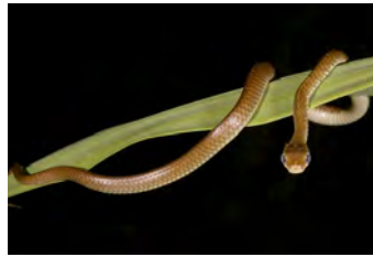
Chironius carinatus Culebra, Cazadora juvenil