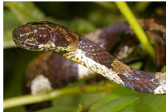
Sibon perissostichon Caracolera