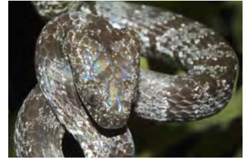
Sibon nebulatus Caracolera