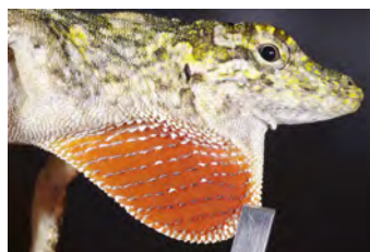
Anolis salvini Anolis papera del ♂