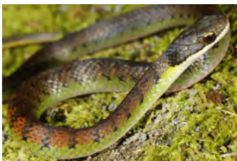
Liophis epinephelus Falsa coral juvenil