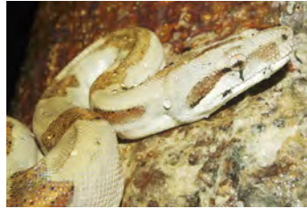
Boa constrictor Boa juvenil