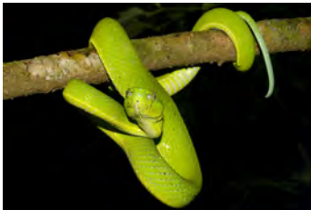
Bothriechis lateralis Lora

Víboras que se encuentran en la vegetación