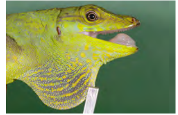
Anolis casildae Anolis gigante papera de la ♀