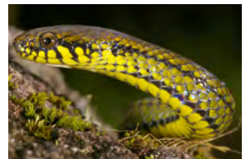
Rhadinaea calligaster Hojarasquera (de vientre manchado)