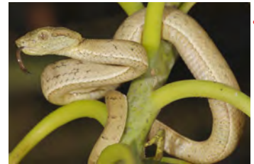
Bothriechis lateralis Lora juvenil