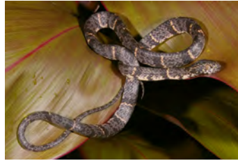
Sibon nebulatus Caracolera