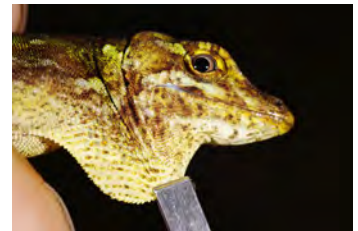
Anolis datzorum Anolis papera de la ♀