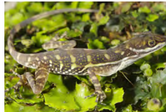
Anolis aquaticus Anolis