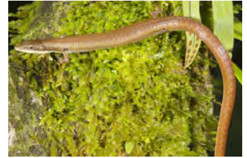
Anadia ocellata Lagartija