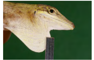
Anolis kemptoni Anolis papa de la ♀