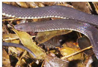
Geophis talamancae Culebra de tierra, Minadora variación negra