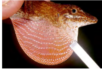
Anolis fortunensis Anolis papa del ♂