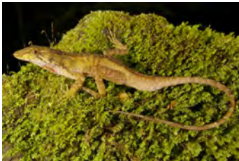
Anolis pachypus Anolis