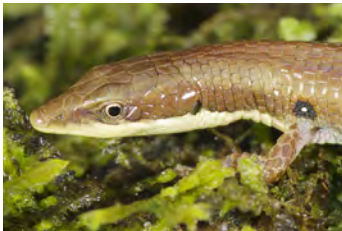
Anadia ocellata Lagartija