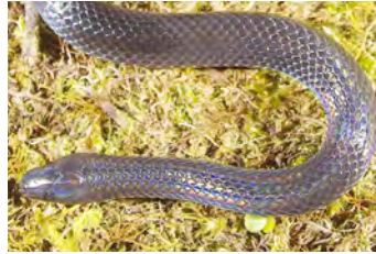
Geophis tectus Culebra de tierra, Minadora