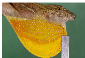
Anolis polylepis Anolis papa del ♂