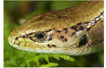
Mesaspis monticola Lagartija de altura ♀