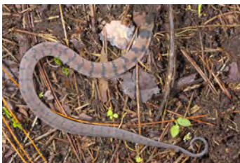
Ninia maculata Culebra de café