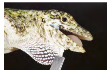
Anolis salvini Anolis papera de la ♀