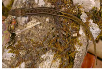
Lepidoblepharis xanthostigma Gecko de hojarasca