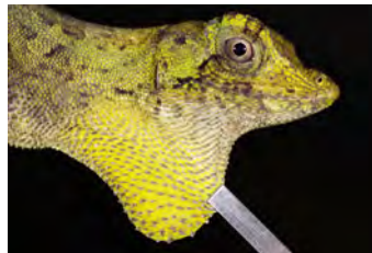
Anolis capito Anolis papera del ♂