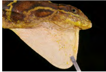
Anolis microtus Anolis gigante papera del ♂