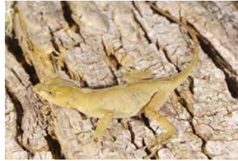
Anolis magnaphallus Anolis