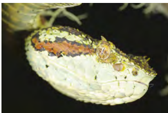
Bothriechis supraciliaris Víbora de pestañas, Oropél notese foseta loreal entre nariz y ojo