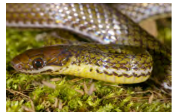
Urotheca sp. Hojarasquera, Cola de vidrio