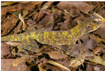
Anolis capito Anolis