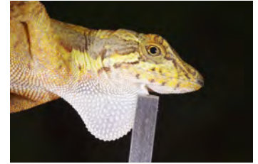
Anolis magnaphallus Anolis papera de la ♀