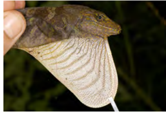
Anolis casildae Anolis gigante papera del ♂