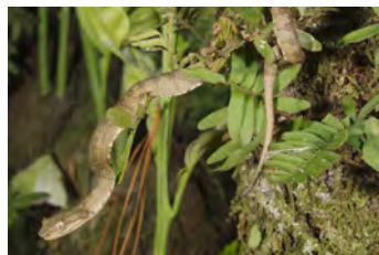
Bothriechis supraciliaris Víbora de pestañas, Oropél juvenil