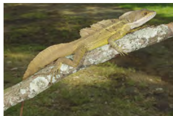
Basiliscus basiliscus Lagarto Jesucristo, Moracho ♂