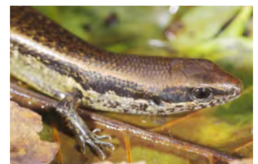
Sphenomorphus cherriei Lisa