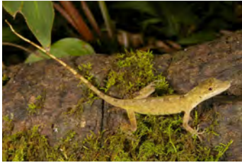
Anolis fortunensis Anolis

documentados en esta área y, si no se indica otra cosa, fotografiados por Sebastian Lotzkat Senckenberg Instituto de Investigación y Museo de Historia Natural & Goethe-Universität, Instituto de Ecología, Evolución & Diversidad Frankfurt am Main, Alemania; E-mail: lotzkat@yahoo.com