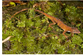
Anolis fortunensis Anolis