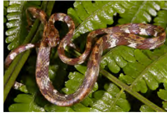
Sibon annulatus Caracolera