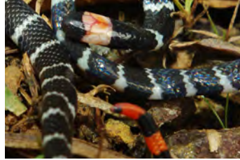
Micrurus multifasciatus Coral