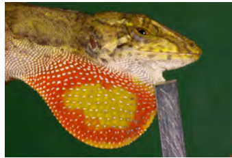
Anolis pachypus Anolis papera del ♂