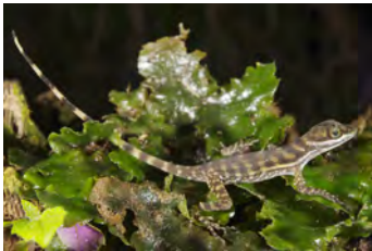
Anolis aquaticus Anolis juvenil