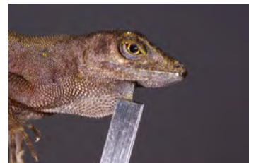
Anolis humilis Anolis papa de la ♀