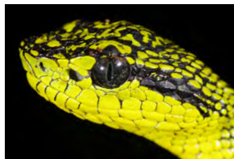
Bothriechis nigroviridis Oropél notese foseta loreal entre nariz y ojo