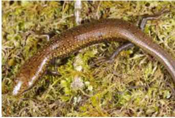
Celestus sp. Lagartija juvenil

documentados en esta área y, si no se indica otra cosa, fotografiados por Sebastian Lotzkat Senckenberg Instituto de Investigación y Museo de Historia Natural & Goethe-Universität, Instituto de Ecología, Evolución & Diversidad Frankfurt am Main, Alemania; E-mail: lotzkat@yahoo.com