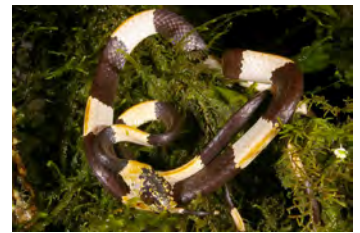
Dipsas articulata Caracolera, Falsa coral