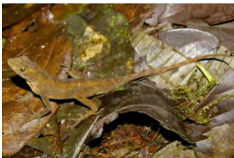
Anolis humilis Anolis