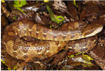
Atropoides picadoi Mano de piedra