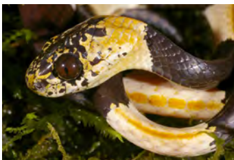
Dipsas articulata Caracolera, Falsa coral