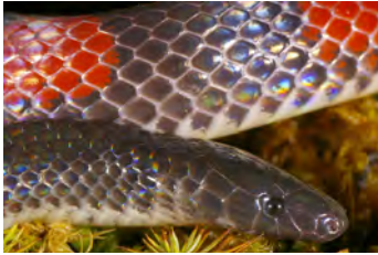
Geophis talamancae Culebra de tierra, Minadora

documentados en esta área y, si no se indica otra cosa, fotografiados por Sebastian Lotzkat Senckenberg Instituto de Investigación y Museo de Historia Natural & Goethe-Universität, Instituto de Ecología, Evolución & Diversidad Frankfurt am Main, Alemania; E-mail: lotzkat@yahoo.com