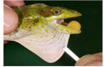
Anolis microtus Anolis gigante papera de la ♀