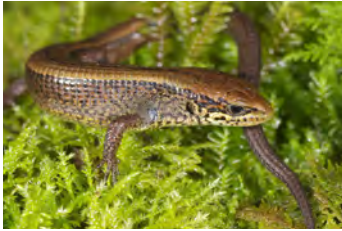
Mesaspis monticola Lagartija de altura juvenil