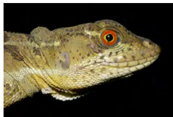
Basiliscus basiliscus Lagarto Jesucristo, Moracho ♀