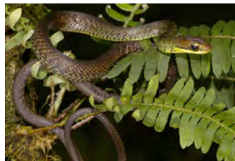
Dendrophidion paucicarinatum Culebra, Corredora