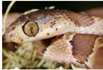
Imantodes cenchoa Bejuquilla de cabeza redonda