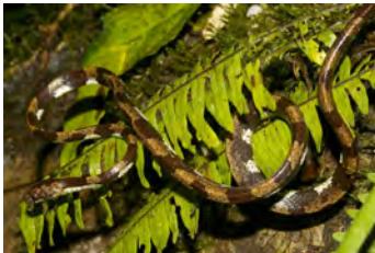
Sibon perissostichon Caracolera