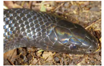
Lampropeltis triangulum Falsa coral, Serpiente de leche variación negra