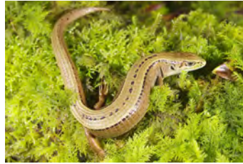
Mesaspis monticola Lagartija de altura ♀