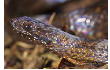
Amastridium veliferum Culebra