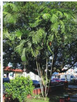
Ptychosperma macarthurii (sigue)