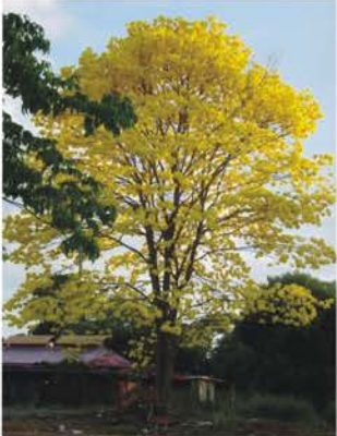
BIGNONIACEAE Tabebuia guayacana Tecoma stans