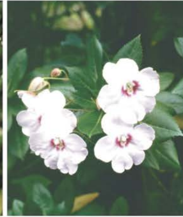
BALSAMINACEAE Impatiens cf. sodenii