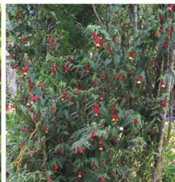
MALVACEAE Abutilon megapotamicum