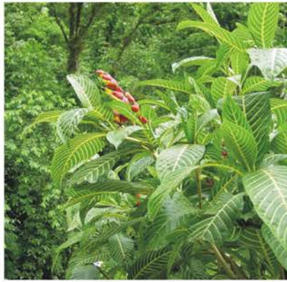
ACANTHACEAE Sanchezia nobilis