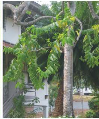
ANNONACEAE Cananga odorata