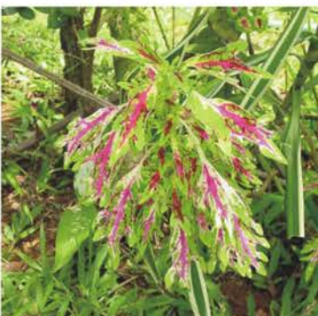
LAMIACEAE Coleus blumieri