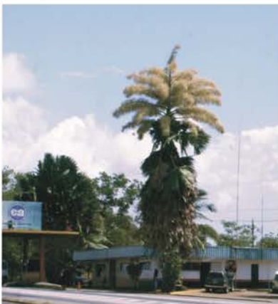
ARECACEAE Corypha umbraculifera