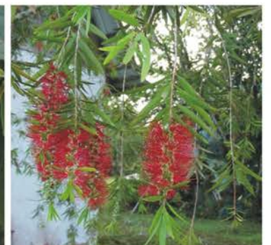
MYRTACEAE Callistemon viminalis