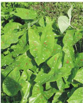
ARACEAE Caladium bicolor