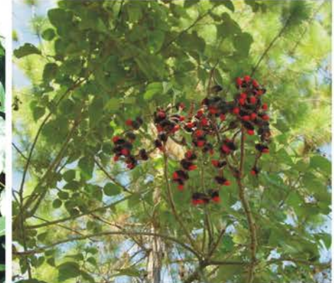
FABACEAE Erythrina sp.