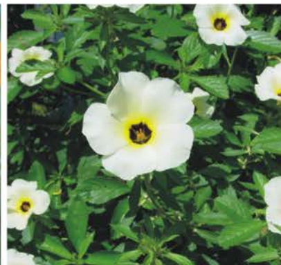
TURNERACEAE Turnera sp.