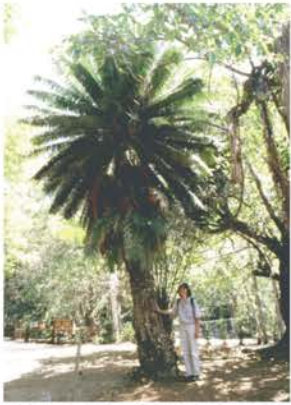
CYCADACEAE Cycas circinalis