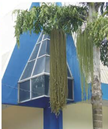
ARECACEAE Caryota mitis