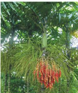
ARECACEAE P. macarthurii