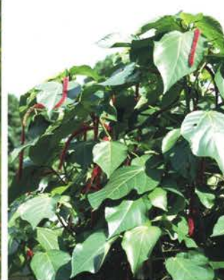
EUPHORBIACEAE Acalypha hispida