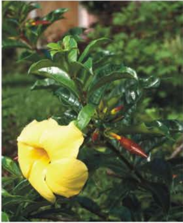
APOCYNACEAE Allamanda cathartica