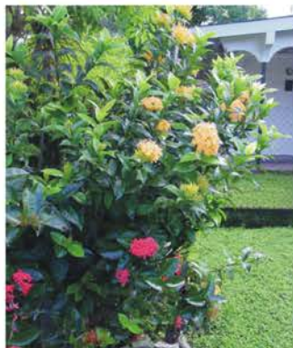
RUBIACEAE Ixora coccinea