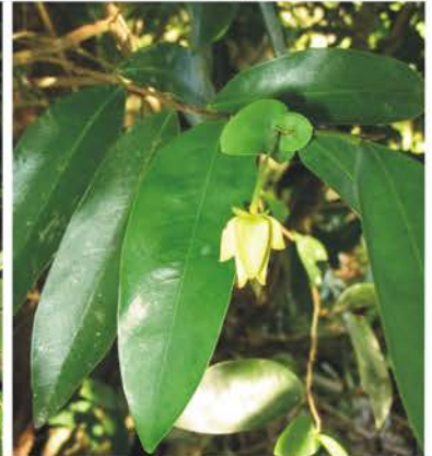
VITTARIACEAE ACANTHACEAE ANNONACEAE Anetium citrifolium Sanchezia nobilis (Ecu) indet. Desmopsis sp.