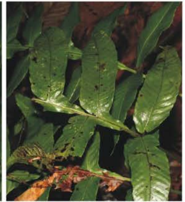
HYMENOPHYLLAC. LOMARIOPSIDACEAE PTERIDACEAE TECTARIACEAE Trichomanes elegans Bolbitis nicotianaefolium Adiantum sp. Tectaria sp.