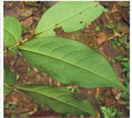
ANNONACEAE CAMPANULACEAE ERYTHROXYLACEAE cf. Guatteria sp. Centropogon granulatus Erythroxylum sp.