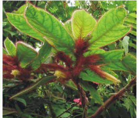
FABACEAE GESNERIACEAE Senna cf. bacillaris Besleria calycina Columnea purpurata