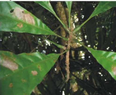
Sapotaceae Pouteria sp.1