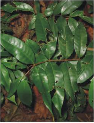
Myrtaceae Eugenia sp.