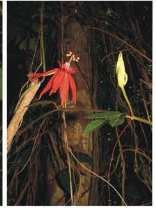
Passifloraceae Passiflora vitifolia