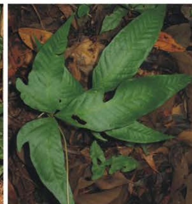
Dicksoniaceae Dennstaedtiaceae Lomariopsidaceae Culeita cf. coniifolia Hypolepis sp. Bolbitis portoricensis Tectaria sp.