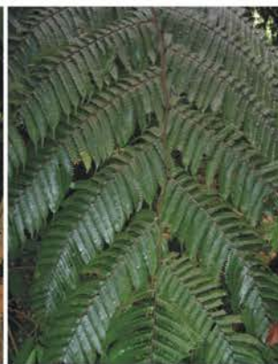
Aspleniaceae Blechnaceae Cyatheaceae Asplenium sp. Salpichlaena volubilis Nephelea sp.