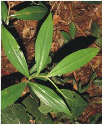
Alstroemeriaceae Bomarea cf. obovata