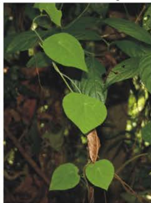
Menispermaceae Ampelocissus sp.