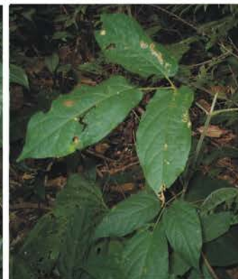
Acanthaceae Anacardiaceae Araliaceae Bignoniaceae Aphelandra sp. Astronium graveolens Oreopanax sp. Cydista sp.