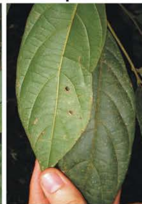
Myristicaceae Compsonura sprucei