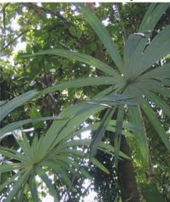
Arecaceae Chrysophila sp.