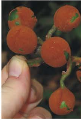
Sapindaceae Paullinia sp.