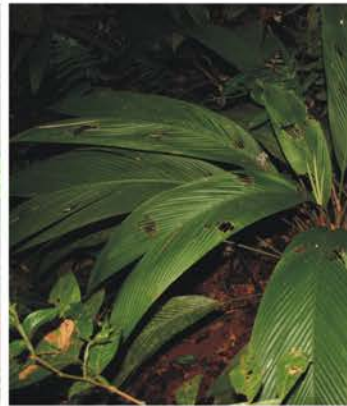
Arecaceae Calyptrogyne sp.