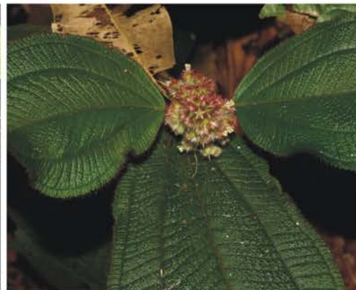
Melastomataceae Miconia sp.