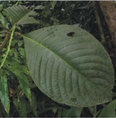
Rubiaceae Psychotria sp.