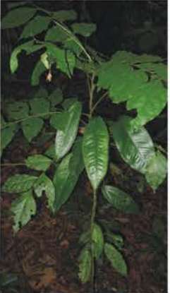
Picramniaceae Picramnia latifolia