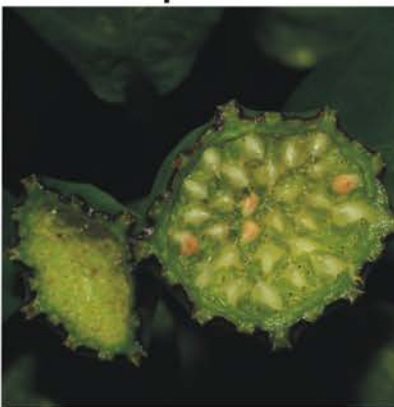
Moraceae Dorstenia choconiana