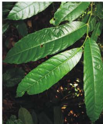
Moraceae Brosimum sp.1