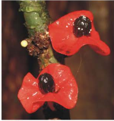
Olacaceae Heisteria sp.