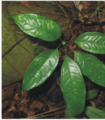
Araceae Anthurium kunthii