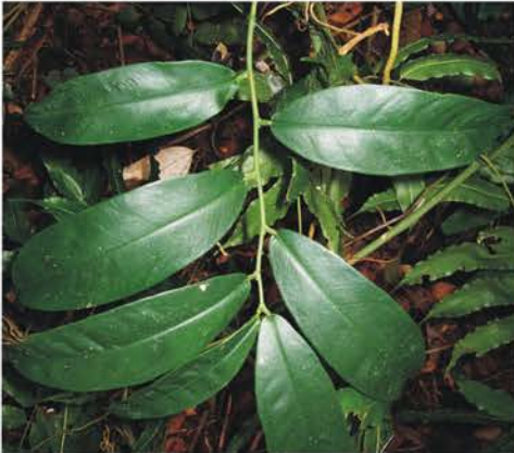
Araceae Heteropsis oblongifolia