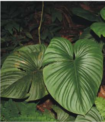
Araceae Philodendron sp.