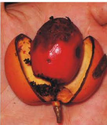
Myristicaceae Compsonura sprucei