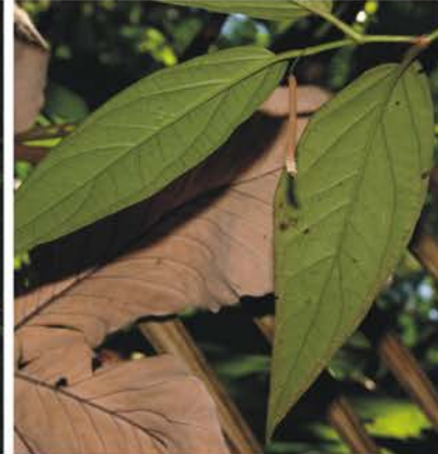
Piperaceae Piper sp.