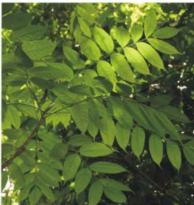
Meliaceae Cedrela sp.