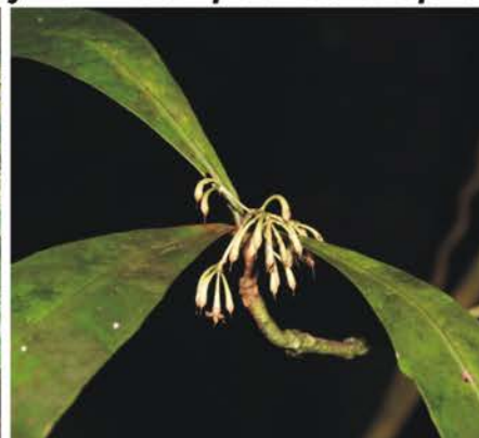
Myrsinaceae Ardisia sp.1