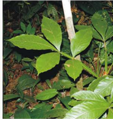
Sapotaceae Chrysophyllum sp.