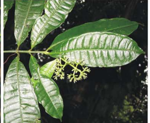
Rubiaceae Palicourea sp.