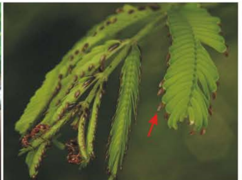
FABACEAE, Mimosoideae Hormigas protegiendo la planta Cuerpos de Belt Acacia costaricensis