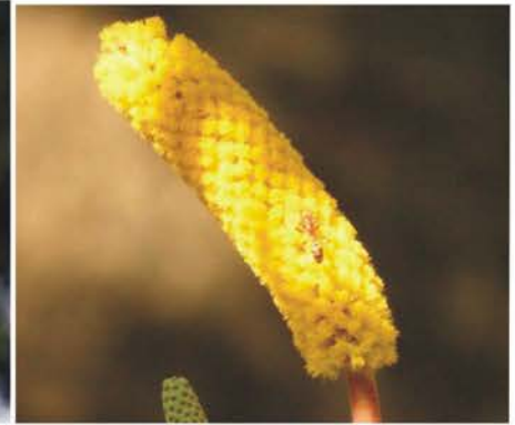
FABACEAE, Mimosoideae Acacia costaricensis