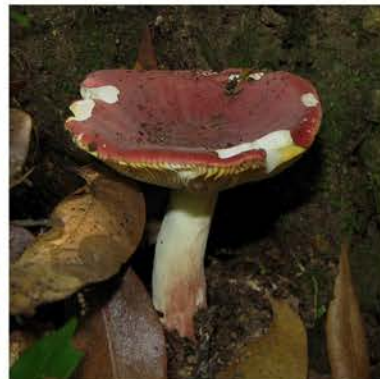
Russula sp. 2