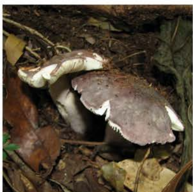
Russula sp. 3