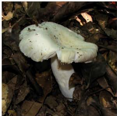
Russula sp. 1

Elaborado en el marco del convenio UNACHI - Universidad de Frankfurt (DAAD)