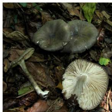
cf. Tricholoma sp.