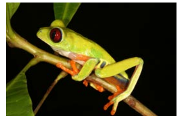
Agalychnis callidryas Rana de ojos rojos; ♂