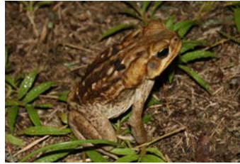
Rhinella marina Sapo común