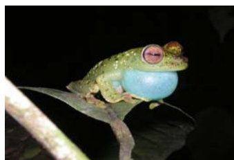
Hypsiboas rufitelus Rana de patas rojas; ♂ cantando