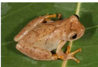
Dendropsophus phlebodes Rana de hoja