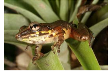
Craugastor talamancae Rana de lluvia de Talamanca