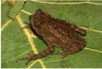
Incilius coniferus Sapo verde