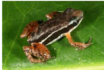
Silverstonneia flotator Ranita cohete rayada