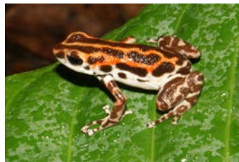
Oophaga pumilio Ranita venenosa Coloración D (Bastimentos)