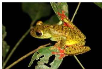
Hypsiboas rufitelus Rana de patas rojas; ♀