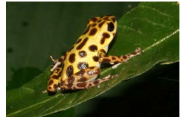
Oophaga pumilio Ranita venenosa Coloración B (Bastimentos)