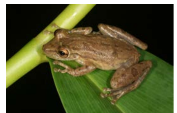
Scinax elaeochrous Rana narizona de huesos verdes