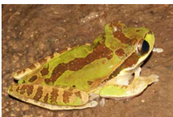
Smilisca phaeota Esmilisca enmascarada