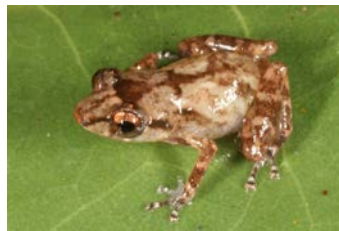
Diasporus vocator Martillita; ♂