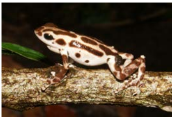
Oophaga pumilio Ranita venenosa Coloración C (Bastimentos)