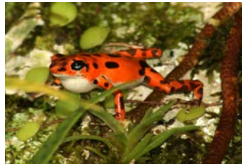
Oophaga pumilio Ranita venenosa Coloración A (Bastimentos)