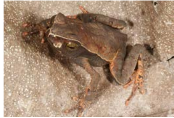
Rhaebo haematiticus Sapo de hojarasca juvenil