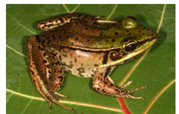
Lithobates vaillanti Rana de patas palmeadas