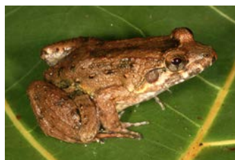
Leptodactylus melanonotus Rana espuma lominegra; ♂