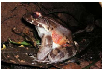
Leptodactylus savagei Rana espuma de Savage