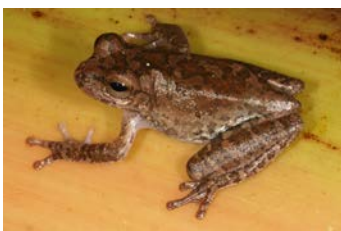
Smilisca sila Esmilisca chata