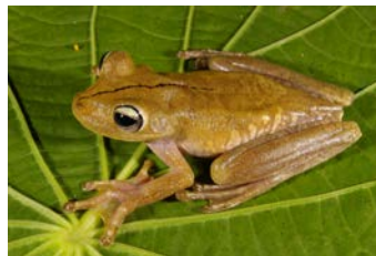
Hypsioboas rosenbergi Rana gladiadora por S. Lotzkat