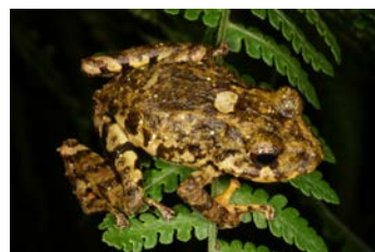
Pristimantis cf. cruentus Rana de lluvia