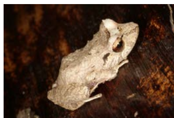
Pristimantis ridens Rana de lluvia enana