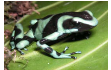
Dendrobates auratus Rana verde y negra