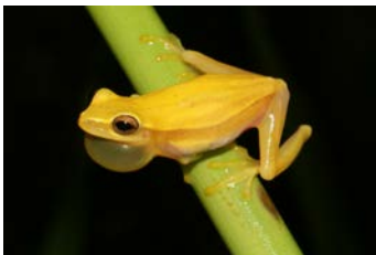
Dendropsophus microcephalus Rana grillo; ♂ cantando