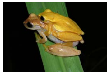
Dendropsophus microcephalus Rana grillo; ♂♀ emparejando