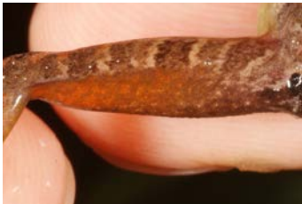
Craugastor crassidigitus patrón del parte trasera del muslo