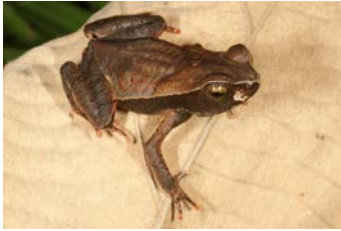
Rhaebo haematiticus Sapo de hojarasca juvenil