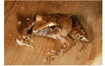
Craugastor crassidigitus Rana de lluvia de dedos anchos