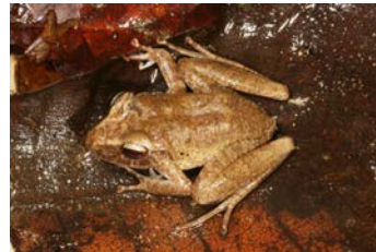
Craugastor fitzingeri Rana de lluvia común