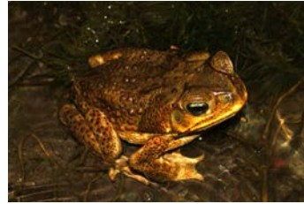
Rhinella marina Sapo común