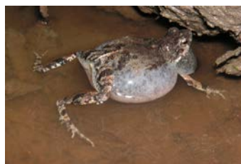
Engystomops pustulosus Rana túngara; ♂ cantando