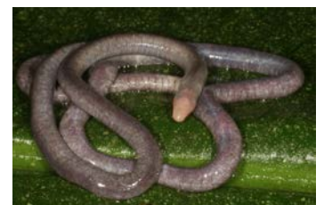
Oscacilia sp. Caecilia fina