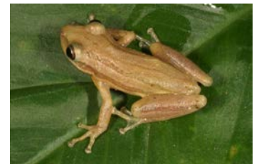
Scinax staufferi Rana narizona de Stauffer