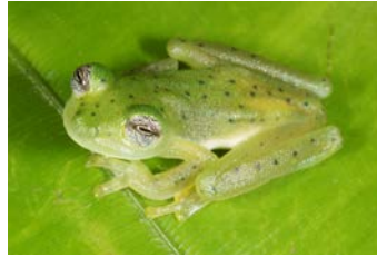
Centrolene prosoblepon Rana de vidrio esmeralda