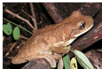
Trachycephalus venulosus Rana lechosa